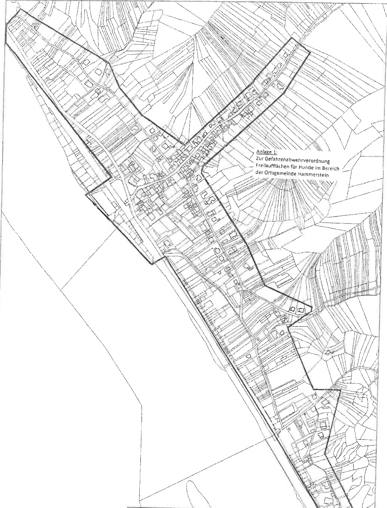
Anlage 1: Zur Gefahrenabwehrverordnung Freilauffflächen für Hunde im Bereich der Ortsgemeinde Hammerstein