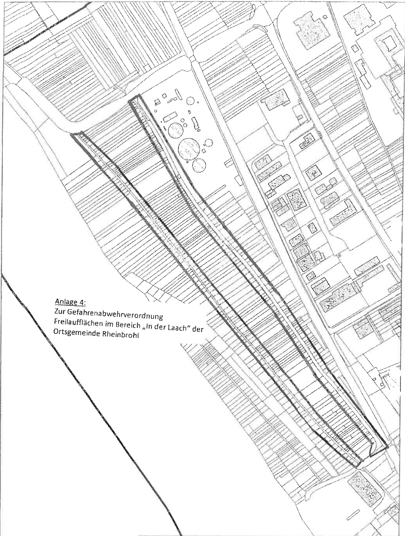
Anlage 4: Zur Gefahrenabwehrverordnung Freilauflächen im Bereich „In der Laach“ der Ortsgemeinde Rheinbrohl